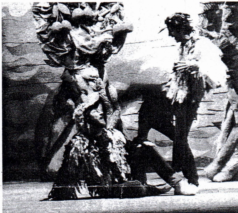
Una scena di «Spaventapasseri amorosi» presentato all'Adua

no più e insieme finiscono vittime del vento del nord che li spazzerà via verso un'isola lontana. Il merlo, il passero e la gazza hanno aiutato gli spaventapasseri a volare consentendone l'ultima trasformazione, in fidanzati e sposi. Nessuno dunque fa più la guardia alle ciliege, logico allora che gli uccelli ritrovino intatta la gioia del furto.